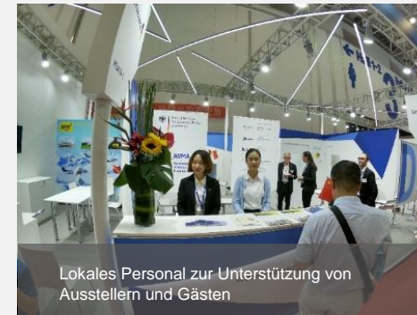
Lokales Personal zur Unterstützung von Ausstellern und Gästen