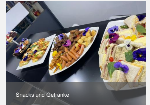
Snacks und Getränke